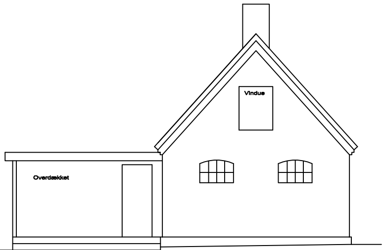
Gavl mod Stationen